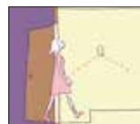
人を感知して点灯