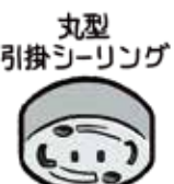
丸型 引掛シーリング