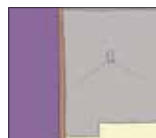
しばらくして消灯