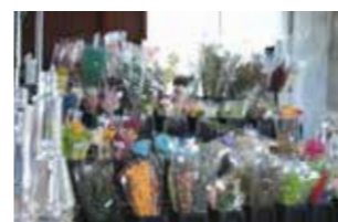
白坂花店 SHOP INFORMATION

もともと難しい要素は少ないので、以上3点に気をつければハーバリウムが作れるはず。さらに美しく仕上げるには、回数をこなすのみ。花とビンを見て、完成した姿がイメージできるようなと上級者だそう。白坂花店では、入門者用のセットを1000円で提供しています。値段も良心的なので、気軽に始めましよう。