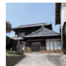
現在リフォーム中のM様邸。