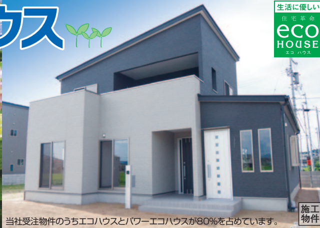
当社受注物件のうちエコハウスとパワーエコハウスが80%を占めています。