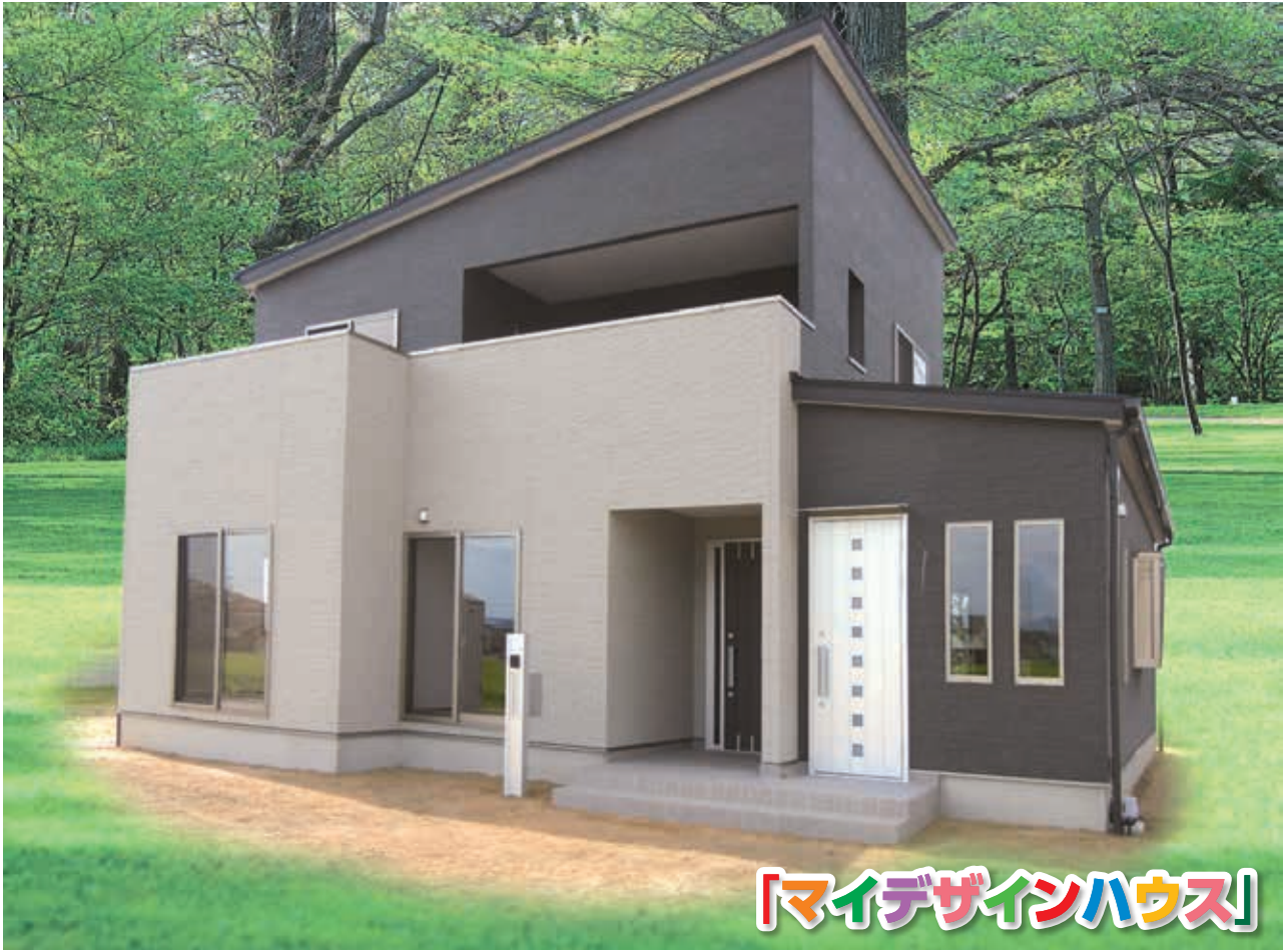
「マイデザインハウス」