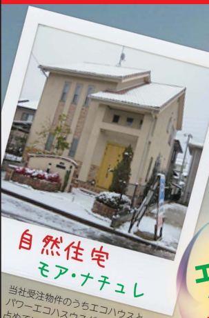
自然住宅 モア・ナチュレ