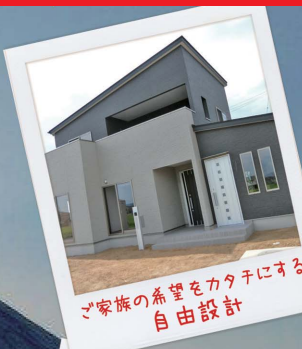
ご家族の希望をカタチにする 自由設計