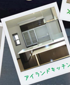
アイランドキッチン