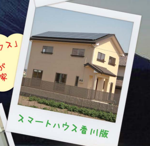
スマートハウス香川版