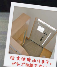
注文住宅承ります。 ぜひご相談下さい。