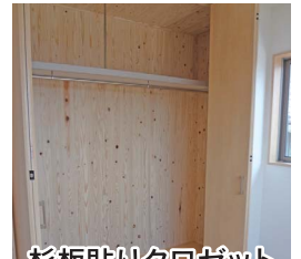
杉板貼りクローゼット